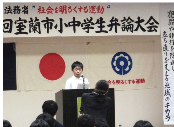
毎年行われる「室蘭市小中学生弁論大会」。今年は10月27日に輪西市民会館で行われました。各小中学校から1名が発表を行いました。

せっかく学校でみんなで学んでいるわけですから、友だちと鎬を削りながら学びをもっと深め、広げてほしいと願ってやみません。