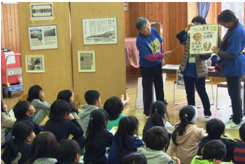
三年生 総合「大好きイタンキ」 鳴り砂保存会の方に鳴り 砂やイタンキの自然について教 えていただきました。