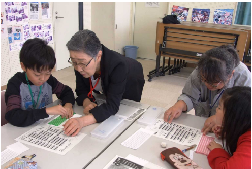
四年生 総合 点訳赤十字奉仕団のみな さんには点字を教わりま した。