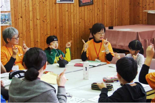
四年生 総合 「優しさの種を育てよう」 手話サークル白鳥の会のみな さんに手話を習いました。

日頃、保護者、地域の皆様には大変お世話になっております。10月・11月は特にそのような活動が多い月でした。