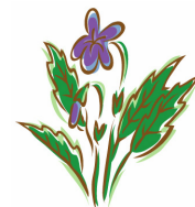
月の誕生花:すみれ